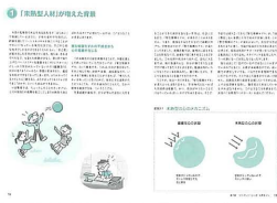
【第3章】未熟型人材が増えた背景

「未熟型人材チェックポイント」より、コミュニケーション方法に配慮が必要な部下を見抜き、対処を学びます。