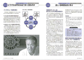
【第2巻】どうすればPDCAはうまく回るのか

E-PDCAトレーニング・コース 価格▶1セット 9,870円(税込) 体裁▶B5判・全4巻・48～64ページ