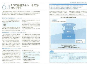
[VOL.1] 3つの基本スキル その③コンセプト