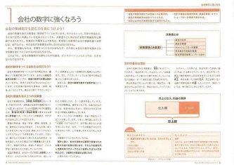
[VOL.4] 会社の数字に強くなる

ミニテスト「レビュー」や巻末「ショートテスト」で、学習内容の理解度をチェックできます。